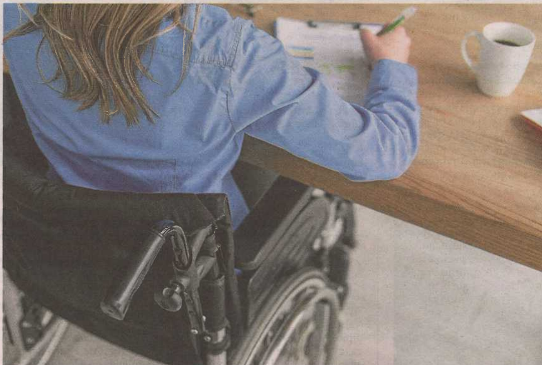
Las personas con discapacidad se han visto afectadas en mayor medida por los ERTE.

Por lo que respecta a los que sí tienen empleo, el último informe de Odismet desvela que se han visto afectados en mayor medida por las fórmulas excepcionales adoptadas en tiempos covid: un 37% ha sufrido un ERTE -frente al 3,1% de la población general-, un 7% ha visto reducida su jornada y un 2% ha sufrido un despido.